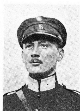
WYNEN, André, né le 14 décembre 1893, à Liège. Lieutenant 5 me Lanciers. Ordre Léopold; Croix Guerre; Médaille Civique 3 me classe. Après avoir vaillamment accompli son devoir, fut enveloppé par les gaz asphyxiants et tomba, intoxiqué, à Stuyvekenskerke, le 1 er juillet 1918, succomba le même jour, à l'hôpital militaire de Cabour.