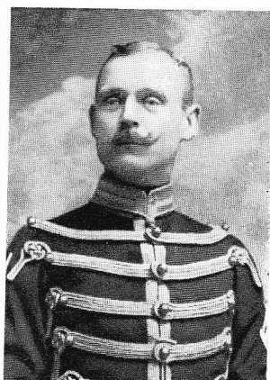
BOURGOIS, Jules, né le 5 mars 1864, à Gand. Major 4 me régiment Lanciers. Off. O. L.; Croix de Guerre; Croix Militaire 2 me et 1 re classe; Médaille commémorative Léopold II. Exemple de bravoure et de courage, tomba glorieusement à Haelen, le 12 août 1914, face à l'ennemi, au cours d'un combat acharné.